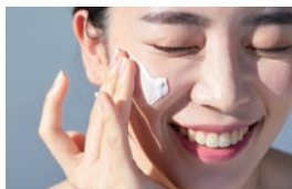
化粧品材料事業 超微粒子酸化亜鉛技術から