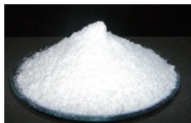
亜鉛事業 白色顔料 酸化亜鉛ZnO→リトボン ZnS・BaSO 4 →酸化チタンTiO 2