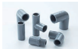
樹脂添加剤事業 ステアリン酸亜鉛から