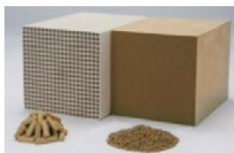
触媒事業 酸化チタンを担体として