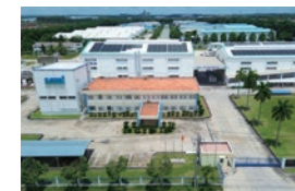
海外生産開始 SAKAI CHEMICAL (VIETNAM) CO., LTD.